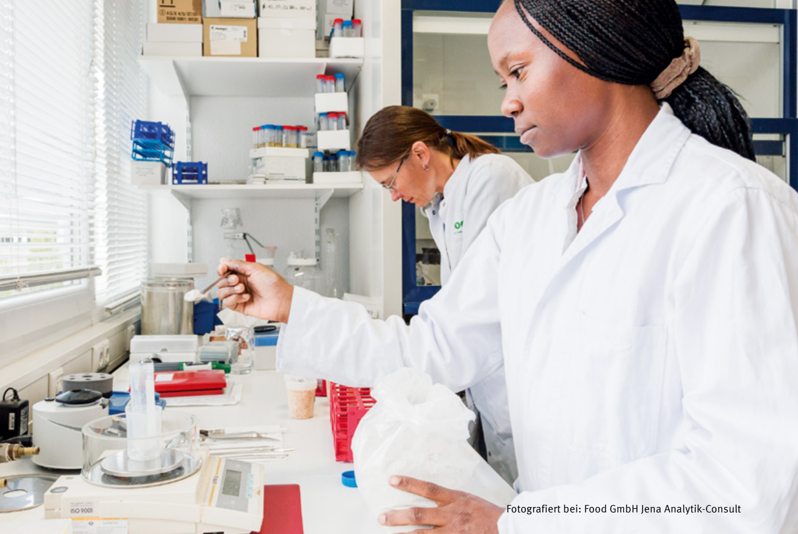
Fotografiert bei: Food GmbH Jena Analytik-Consult